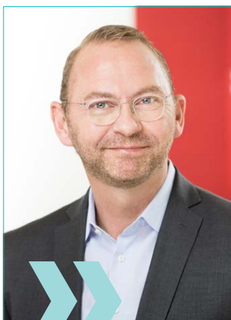
Frank Werneke ver.di-Vorsitzender

Die Länder werden aufgefordert, das Verhandlungsergebnis zeit- und wirkungsgleich auf die Beamt*innen sowie auf Versorgungsempfänger*innen der Länder und Kommunen zu übertragen.